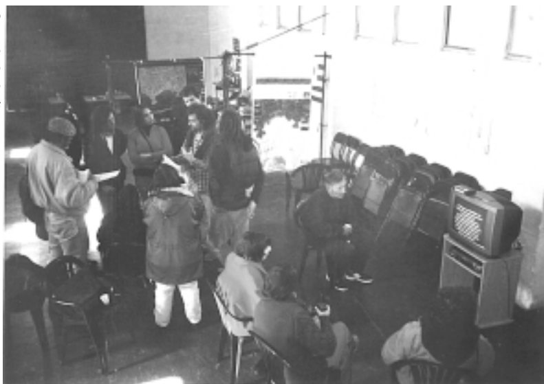
Intercambio en la feria y espacio de exhibición de videos de diferentes proyectos.