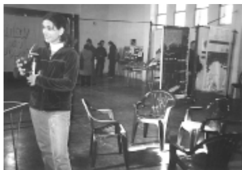
Al fondo las carteleras de Comuna Tierra, seguidas por la mesa de los productores del Oeste y los mapas y bandera de Pro Parque.