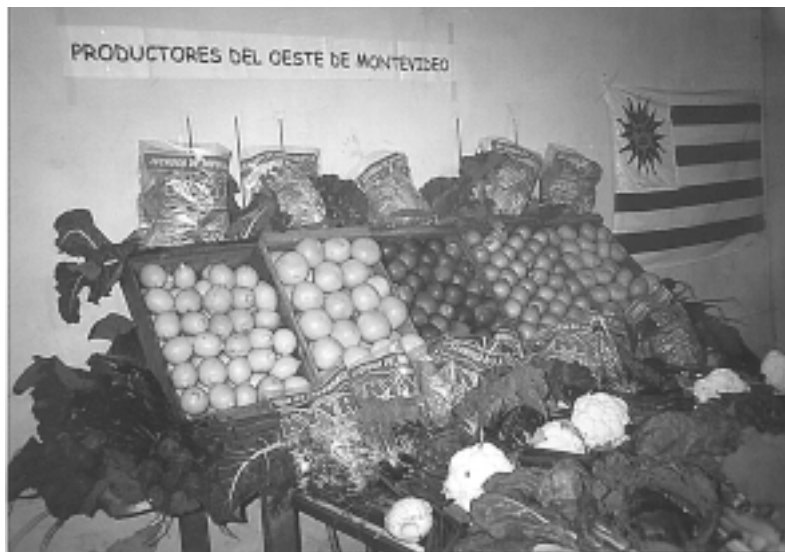
Mesa de los productores de Paso de la Arena