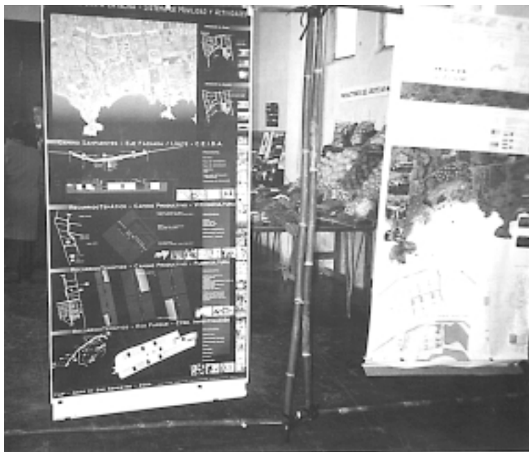
Mapas con el proyecto del Parque de Punta Yeguas realizado por el grupo Pro-Parque de Santa Catalina con el apoyo estudiantes y docentes de la Facultad de Arquitectura.