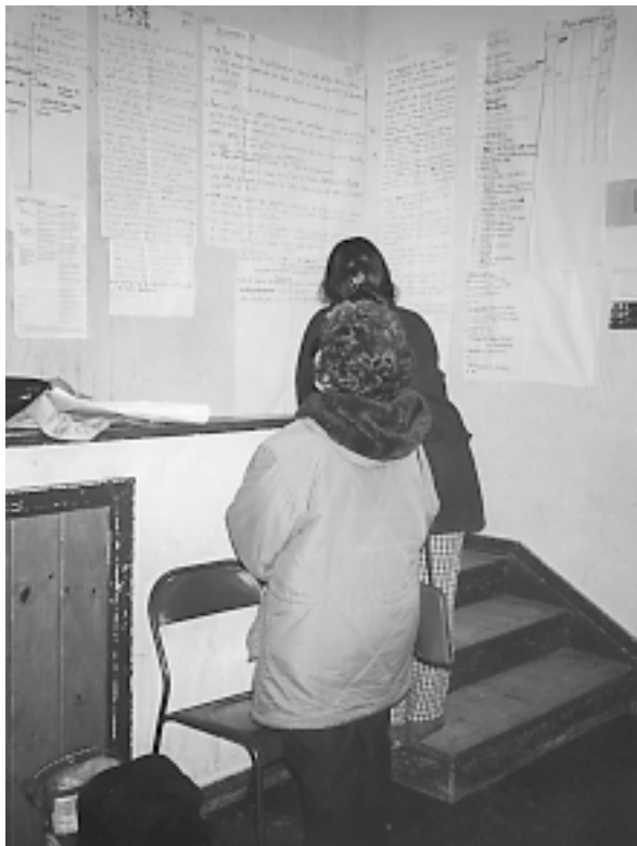
Papelógrafos del taller "Pinceladas del Oeste" y del Ejercicio Prospectiva Participativa para el Oeste realizado por La Placita.